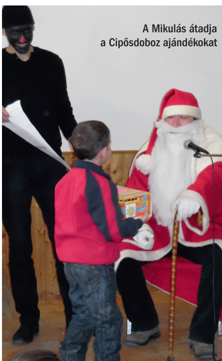
A Mikulás átadja a Cipősdoboz ajándékokat