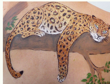
A 2014-es nemzetközi internetes versenyen győztes „Párduc a fán” címet viselő alkotás.

Mégis az eddigi munkásságom legnagyobb kihívásával 2014. novemberében kellett megbirkóznom. Meghívást kaptam az Európai Testfestő Bajnokság Magyarországi elődöntőjére. Nyílt páston, szigorú szabályok betartásával, 5 óra leforgása alatt kellett elkészíteni egy egész alakos kompozíciót, a „Képzőművészetek meste-