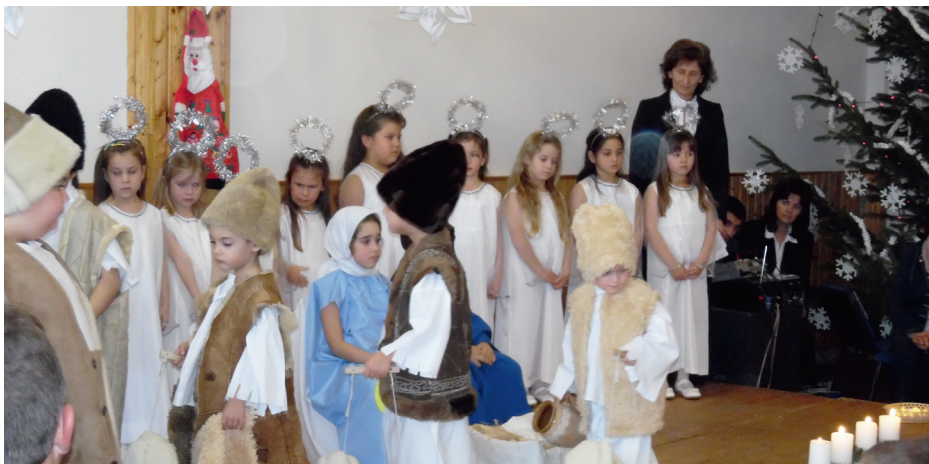
A Meserét Óvoda Szent Lajos úti óvodásainak műsora

A szolgálatok által meghirdetett „Cipősdoboz” akcióra 2014. évben is szép számban érkeztek az ajándékokkal és szeretettel megtöltött dobozok a város lakosságától.