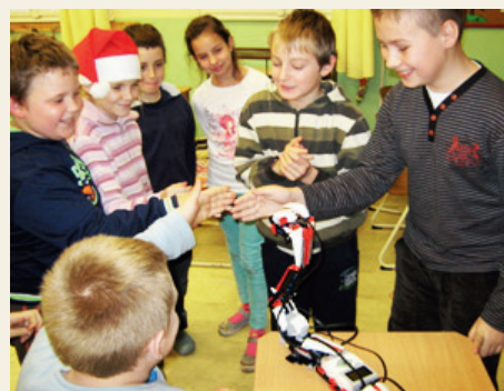
Ismerkedés a 'Robottal'