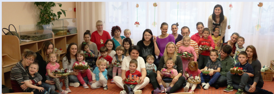
Az ügyes Gomba csoportos kisgyermek szüleikkel együtt csodálatos adventi koszorúkat készítettek