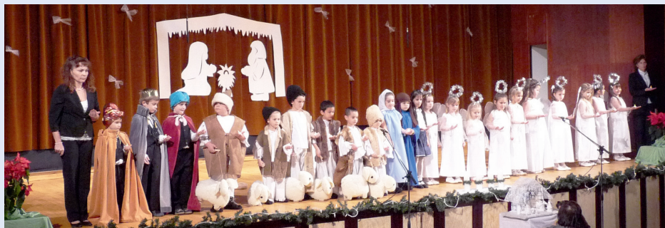
A betlehemi jászokkiállítás megnyitóján a Meserét óvoda Szent Lajos utcai tagintézményébe járó gyermekek színvonalas műsorral ajándékozták meg a résztvevőket