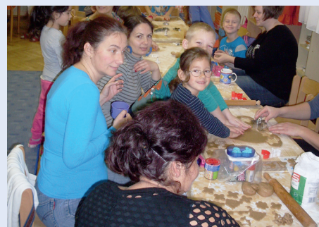
Mézeskalács sütés a szülőkkel a Napraforgó csoportban