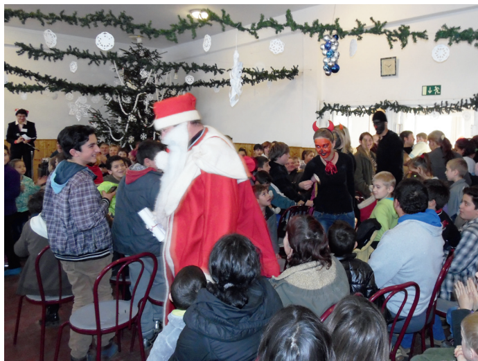
Megérkezett a Mikulás és a krampuszok