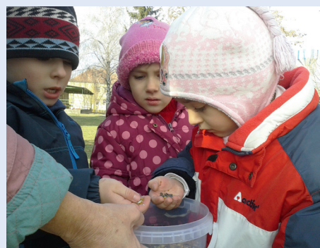
„Mit is esznek a madarak?” – magvakat válogatnak a Süni csoportos gyermekek